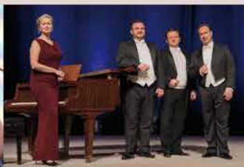
Tři tenoři CZ