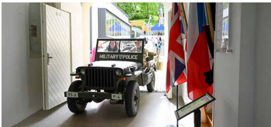
Program Dne otevřených dveří v Domě Chopin naleznete ZDE >