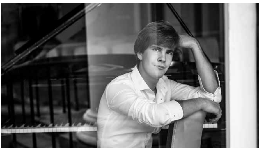
Program Domu Chopin naleznete ZDE >

Ve středu 23. dubna od 19.30 se na Malé scéně uskuteční přednáška Děti a pornografie – O čem mluvit a o čem se nemluví? Lékařka Dominika Benešová se bude věnovat