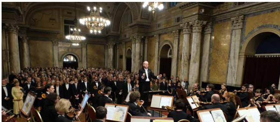
Více o festivalu ZDE >

15. 8. 2026 19:30 Slavnostní zahajovací koncert Společenský dům Casino Chopin: Koncert pro klavír a orchestr č. 2 f moll op. 21 Bizet: Sym-