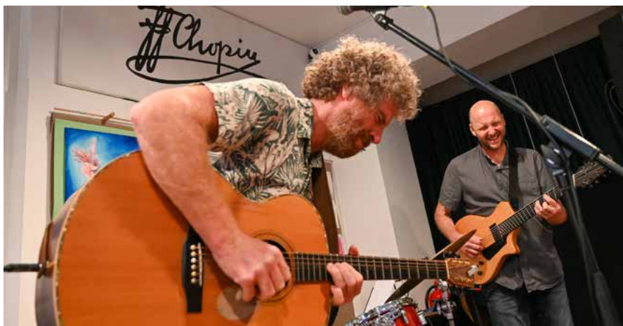
Program v Domě Chopin naleznete ZDE >